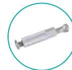
ANCRAGE TÉLESCOPIQUE ALU PLAGE BÉTON