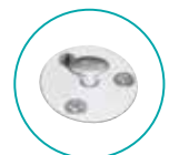
ANCRAGE TÉLESCOPIQUE PLAGE BOIS (INOX/DOUILLE ALU)