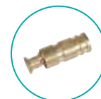
ANCRAGE TÉLESCOPIQUE LAITON