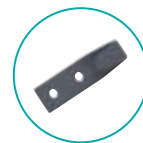
CROCHET MURET PLASTIQUE

Pour plus d'informations sur ce produit, demandez conseil à votre piscinier.