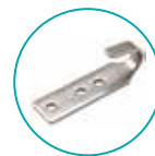
CROCHET MURET INOX