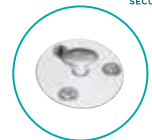
ANCRAGE TÉLESCOPIQUE PLAGE BOIS (INOX/DOUILLE ALU)