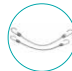
SANDOW 2 EMBOUTS