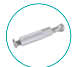
ANCRAGE TÉLESCOPIQUE ALU PLAGE BÉTON